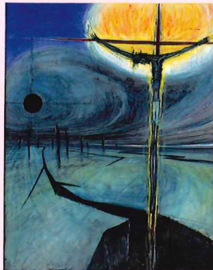
堀江 優「十字架に背く」1968年 水彩・紙 ※後期のみ展示