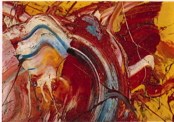
白髪一雄「赤のひろがり」と青い線」1970年頃 油彩・キャンバス