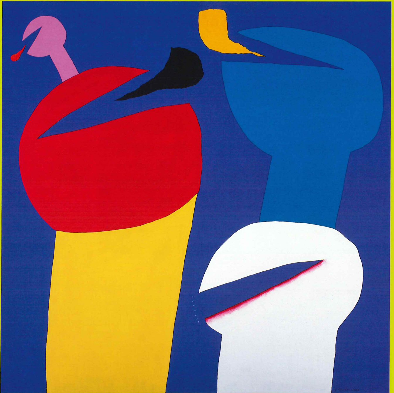
元永定正「作品 F-004」1970年 アクリル・布 (2013年新収蔵)