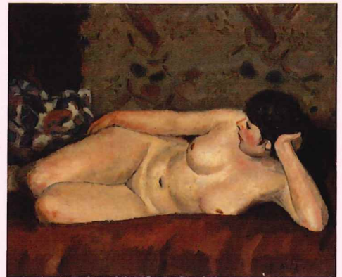
三木朋太郎「横臥裸婦」1927~30年頃 油彩・キャンバス 神戸・北野White House コレクション