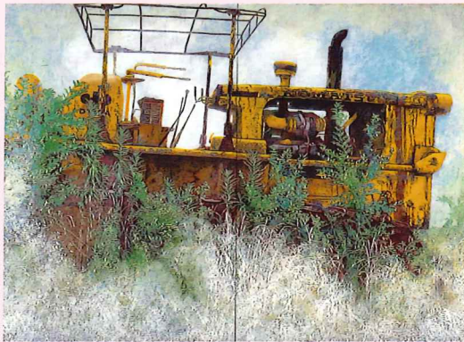
西田真人「置き去り」1992年 紙本着色 ※前期のみ展示