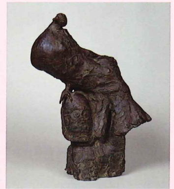
柳原義達「鳩」制作年不詳 ブロンズ