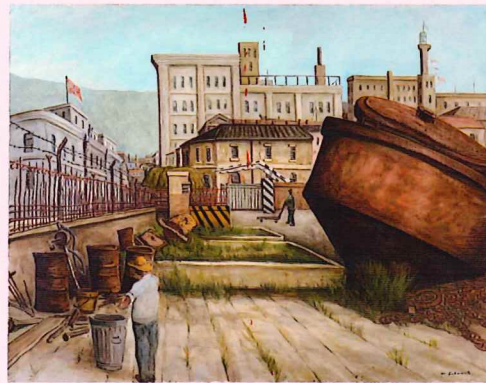
坂本益夫「プイのある風景」1953年頃 油彩・キャンバス