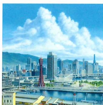
描き下ろし新作(文月の神戸) 2016年 ©山本二三