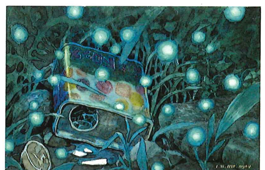
火垂るの墓(捨てられた思い出) 1988年 ©野坂昭如/新潮社,1988