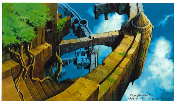
天空の城ラピュタ(荒唐したラピュタ) 1986年 ©1986二馬力・G