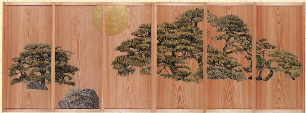
繁昌(杉戸絵 表6面) 2015年

本展では、伊勢神宮の内宮・外宮をえがいた杉戸絵を特別展示し、これまでに完成した三十二点の作品を、写生とともにお披露目します。心ゆくまで清浄で诗情豊かな日本画の美を、ご鑑賞ください。