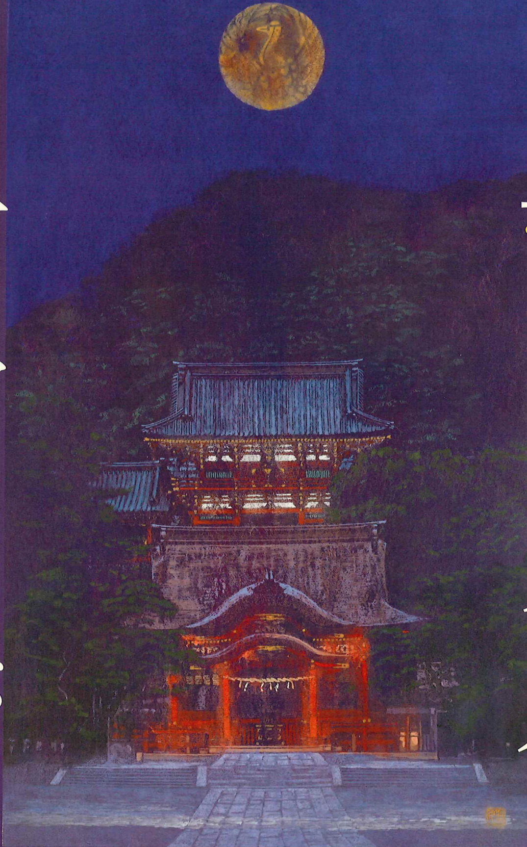
「Iwatorii」2017年 敬愛まちづくり財団蔵