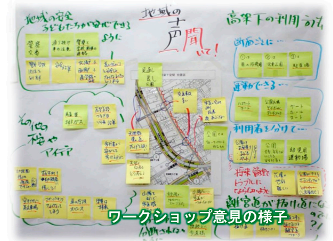
ワークショップ意見の様子