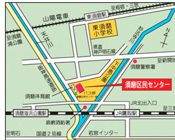
須磨区民センター 位置図

須磨区民センター 4 階大ホール （須磨区中島町 1-2-3） ※駐車場は有料です。