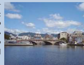
新川運河に架かる大輪田橋

清盛は、港に風よけ波よけのため、経ヶ島(経の島、兵庫嶋ともいう)と呼ばれた人工島を築きました。経ヶ島の呼び名の由来は、人工島の築造が難工事であったため、経文を書き写した石を海に沈めて工事が進められたためで、『平家物語』にこのような記述がみえます。