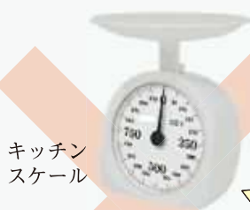
キッチン スケール