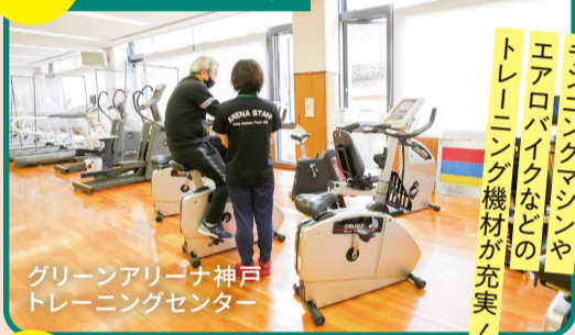
グリーンアリーナ神戸 トレーニングセンター