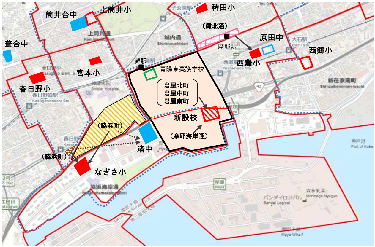
〈参考〉神戸市立灘の浜小学校校区図（案）