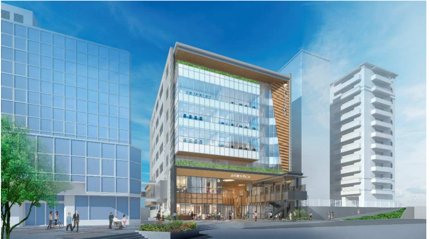
北側外観・名谷駅方面