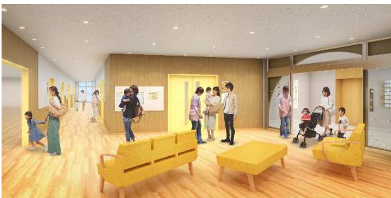
「日向ぼっこ」をイメージ