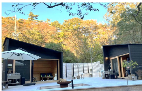
(休憩キャビンイメージ)

豊かな自然や多数の登山道を有する六甲山系や丹生山系などに、国内外からの誘客をはかるため、JR新神戸駅内の登山拠点や登山道沿いの休憩キャビンを整備するとともに、山麓周辺の店舗による登山サポート体制を構築する。また、山の新たな魅力を創出するため、つくはら湖を活用したアクティビティを検討する。