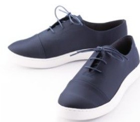
SDGs 関連商品 神戸シューズ・漁網スニーカー

また、神戸空港就航都市である青森県と連携し、双方の産業の強みを活かしたビジネスマッチングの開催や販路開拓を支援する。