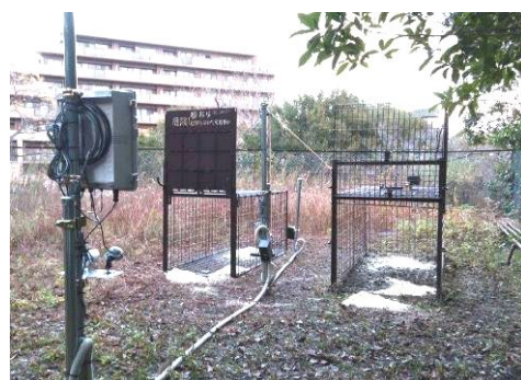
(遠隔操作できる捕獲わな)

また、ため池等でのナガエツルノゲイトウ (特定外来生物) による農業被害を防止するために、通報窓口の設置、専門家による同定及び防除支援などの体制を整備する。