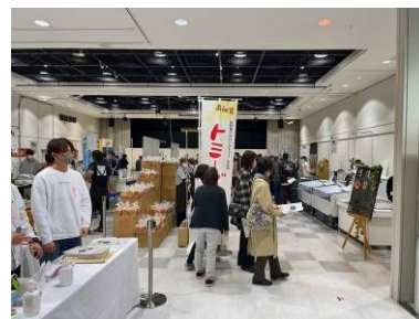
(R4 青森県内での展示会)