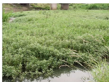
(ナガエツルノゲイトウ)