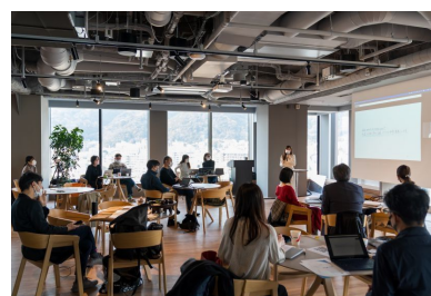
(マッチングプログラムイメージ)

市内企業の革新的な事業開発や課題解決に向けて、有用な技術等を持つ企業とのマッチングプログラムを実施する。あわせて、企業やクリエイターなどがオープンイノベーションを実践するコミュニティを運営し、新たなビジネスが自発的に生まれる環境を創出する。