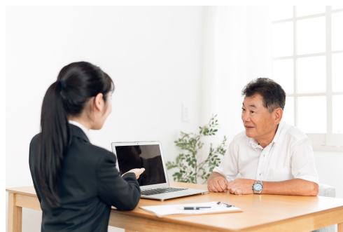
(キャリア相談のイメージ)