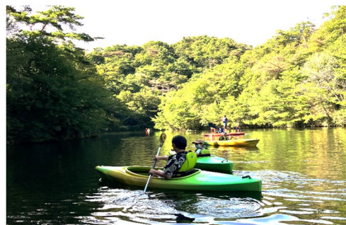
(湖面活用イメージ)