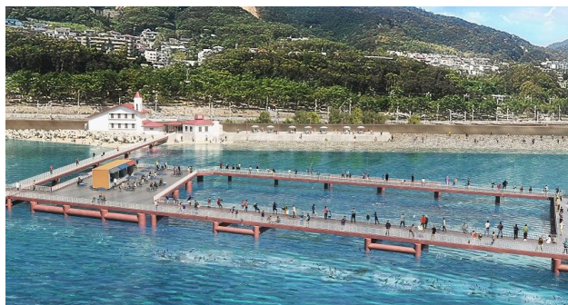
(須磨海づり公園イメージパース)

須磨海づり公園の再開に向けて、管理塔や釣台の一部を撤去するとともに、被災が少ない釣台の復旧および陸上施設の整備を行う。また、撤去部材を活用した漁礁の設置や藻場形成調査等、豊かな海づくりに取り組む。